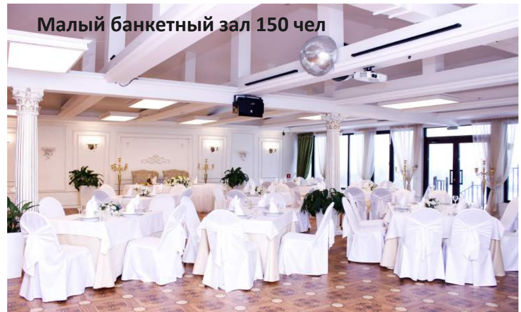
Малый банкетный зал 150 чел