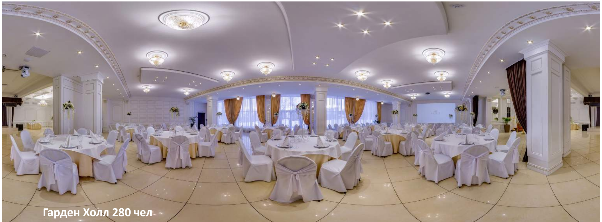
Гарден Холл 280 чел